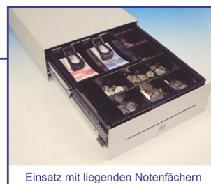
Einsatz mit liegenden Notenfächern