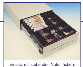
Einsatz mit stehenden Notenfächern