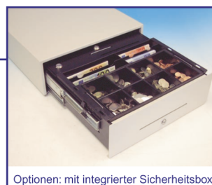
Optionen: mit integrierter Sicherheitsbox