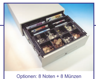
Optionen: 8 Noten + 8 Münzen